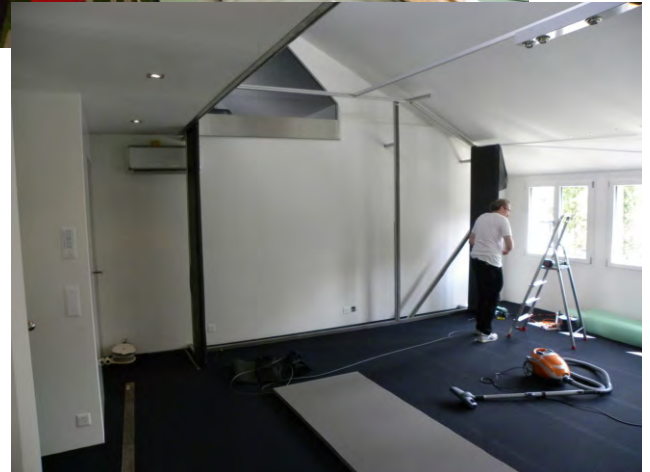
Noch fast am Beginn der Installation - der Umfang ist jedoch bereits erkennbar.