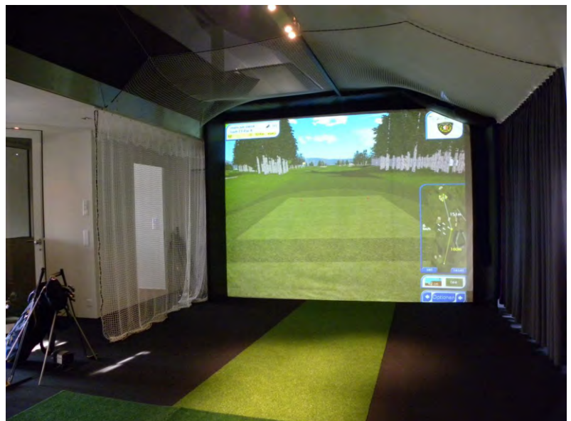
Das Ergebnis erfüllt alle Anforderungen! Wieder ein begeisterter Kunde.

B&F Services GmbH Alpenstrasse 1 6304 Zug kontakt@one4golf.ch